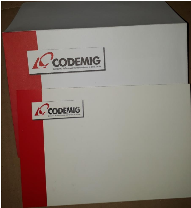
LOTE 02: EXEMPLO ENVELOPE TIMBRADO (GRANDE) 25X35 CM